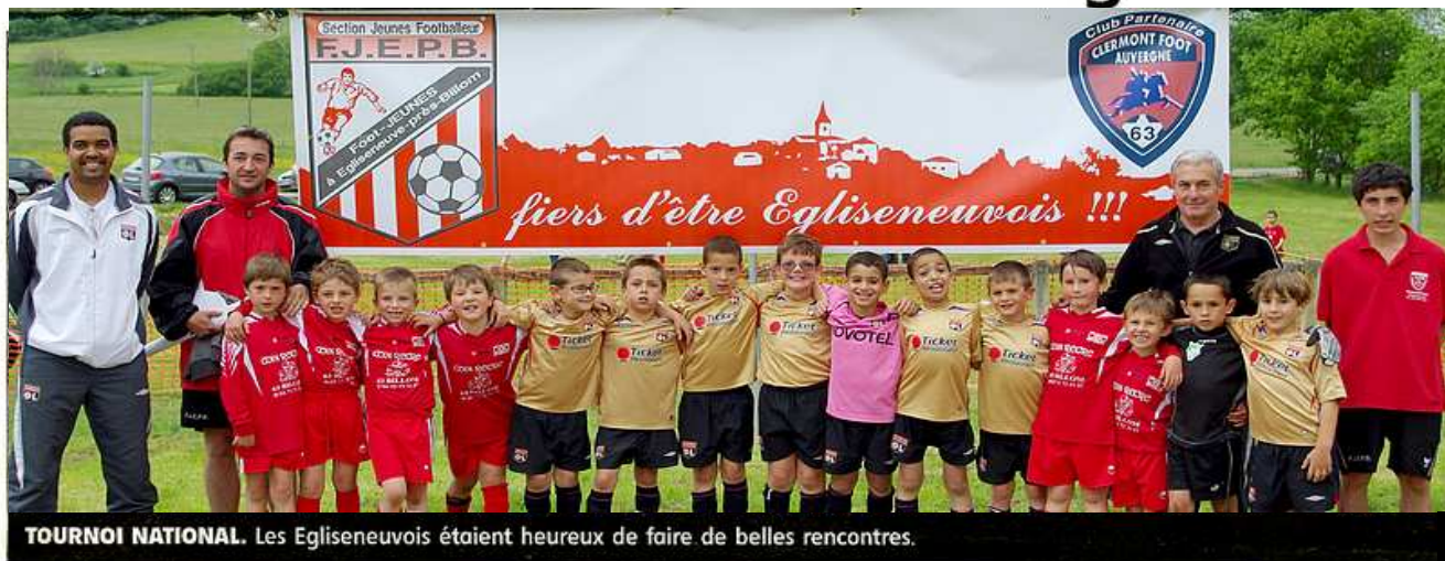
TOURNOI NATIONAL. Les Egliseneuveois étaient heureux de faire de belles rencontres.

Le neuvième tournoi national a vu converger près de 600 petits footballeurs venus de huit départements, avec un petit nouveau cette année : rien moins que l'Olympique lyonnais. Les poussins et débutants n'étaient pas peu fiers de représenter ou d'affronter de grands clubs très fidèles, comme l'AS St-Etienne, le FC Metz, l'OL, ainsi que le Clermont-foot Auvergne. C'est le but recherché de