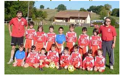
Composition des groupe de niveau :