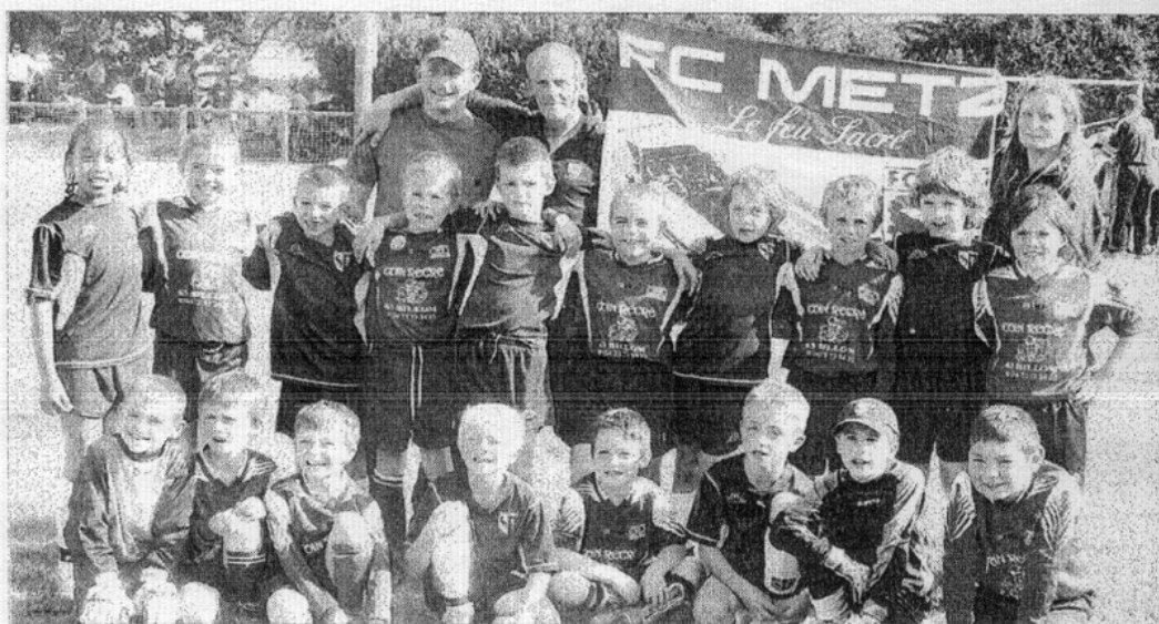
FOOTBALL. L'équipe des débutants d'Egliseneuve a pu profiter d'une journée sans pluie.