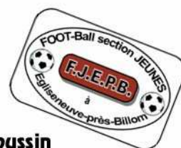
Petit modèle pour les Débutant-Poussin